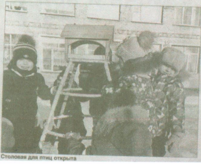
Столовая для птиц открыта

Собрали урожай подсолнечника и рябины с участка детского сада. Корма недостаточно для зимовки птиц, поэтому мы с ребятами решили провести экологическую акцию по сбору корма, проинформировали родителей.